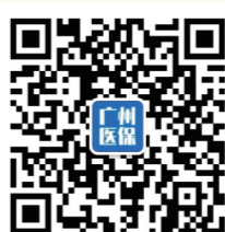
广州医保微信公众号

温馨提示：本资料内容如果与政策文件有出入或政策发生调整，请以最新公布的政策为准。