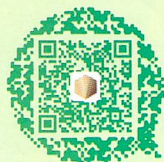
微信公众号 国科大心理中心

微信公众号“国科大心理中心”，信息及时、内容丰富，师生联系的重要桥梁，获取专业资源的重要渠道。