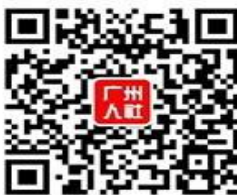
广州人社官方微信