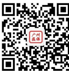
广州医保官方微信

温馨提示： 本宣传资料内容如果与政策文件有出入或政策发生调整，请以最新公布的政策为准。